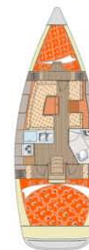
Y 37 Lež.: 6+2