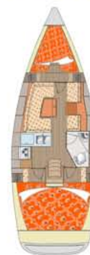
Y 37 Persone: 6+2