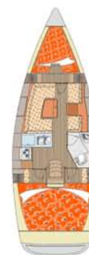
Y 37 Lež.: 6+2